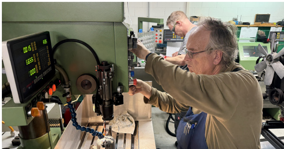
Arbeiten an Bohrmaschine und Fräse.

Ein grosses Dankeschön an alle für ihren tatkräftigen Einsatz!