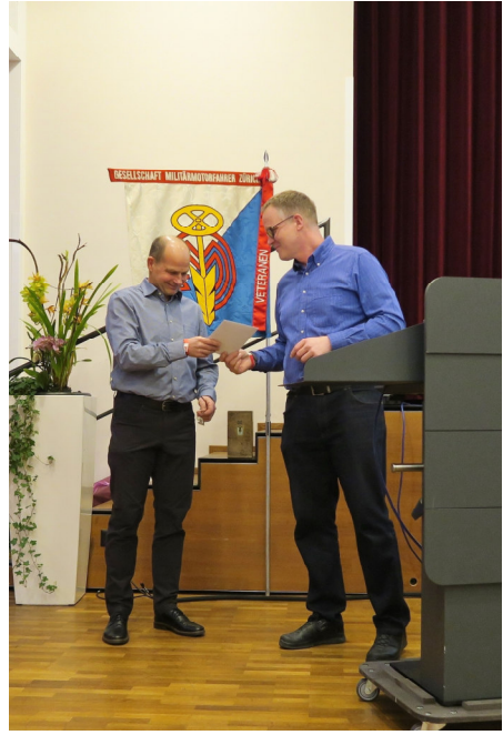
Für ihre langjährige Tätigkeit geehrt und beschenkt.