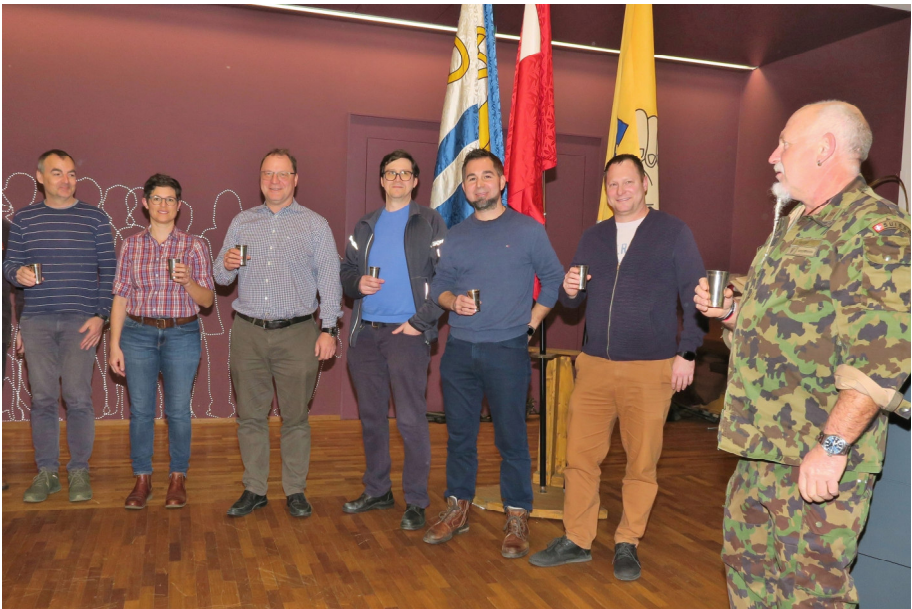
Unsere neuen Veteranenmitglieder.