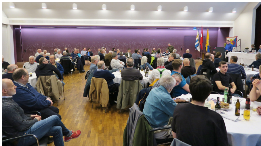
Die Generalversammlung war gut besucht.

Die Versammlung wurde mit der Nationalhymne und dem Ausmarsch der Fahne geschlossen. Der Vorstand führte souverän und speditiv durch die Traktanden. Die Stimmung im Saal war kameradschaftlich und von hoher Wertschätzung getragen. Ein grosses Dankeschön an den Vorstand und herzliche Gratulation an die Geehrten.