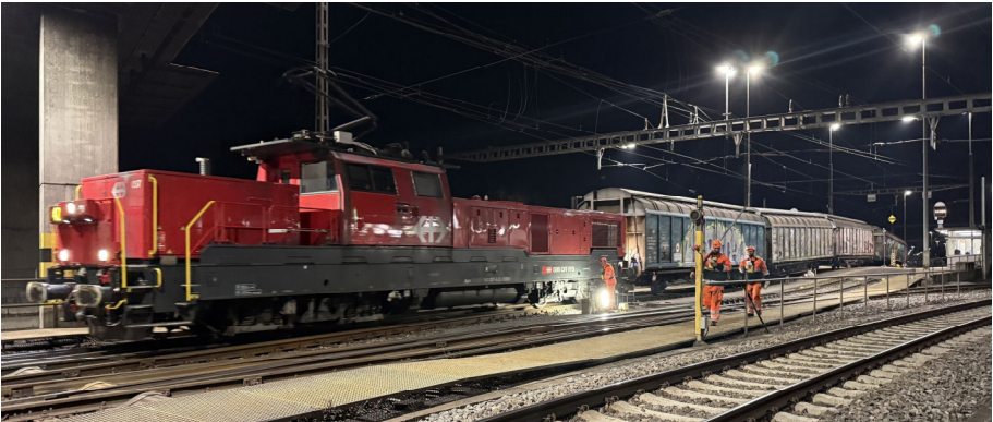
Oben: Die Lokomotive schiebt die Güterwagen den Ablaufberg hoch.