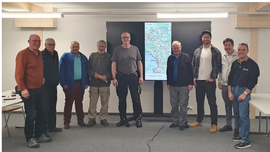
Karte, Teilnehmer und Kursleiter.