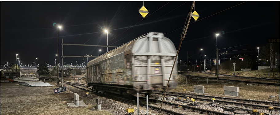
Unten: Der Güterwagen unterwegs zum richtigen Gleis.